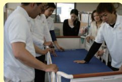
快適な住環境設備と介護