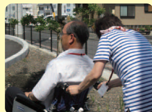
車いすの使い方と移乗介護